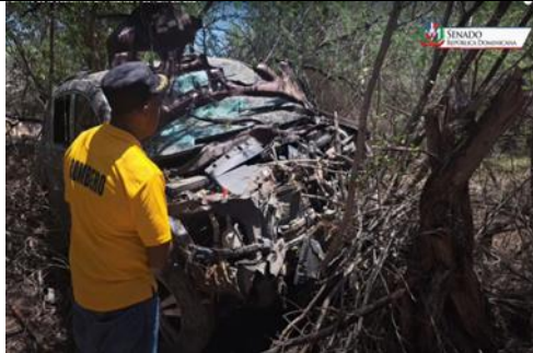
Accidente ocurrido en la carretera del distrito El Limón

Acta núm. 0214, del martes 09 de abril de 2024, pág.46 de 86