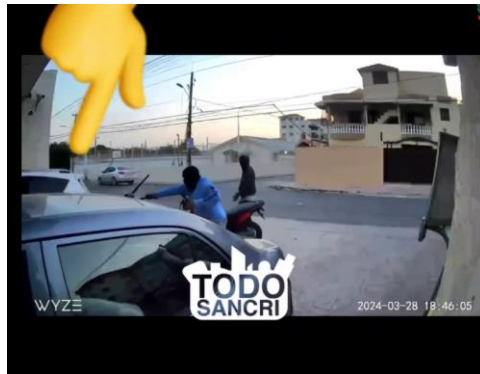
Intento de asesinato a pareja de empresarios en San Cristóbal.