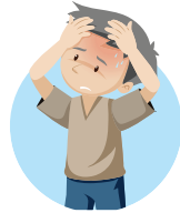
Dolor de cabeza